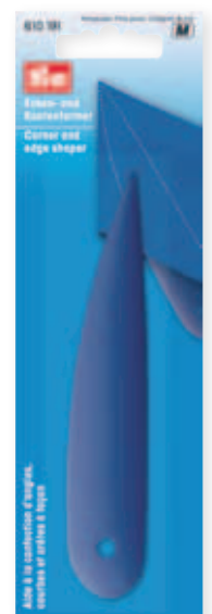
E 57 x 185 mm