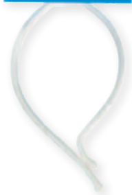
B 60 x 195 mm