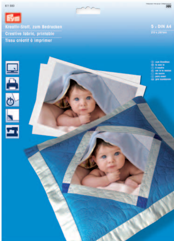
A 235 x 323 mm