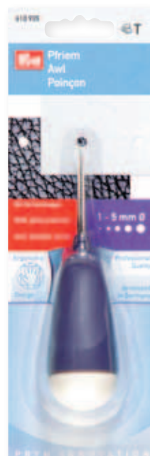
C 67 x 210 mm