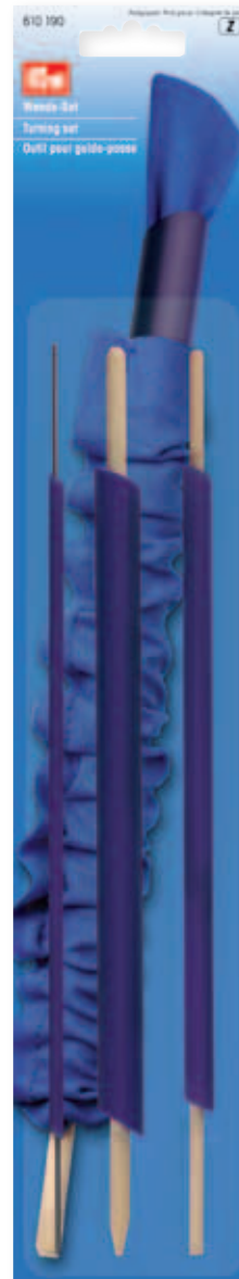
D 73 x 350 mm