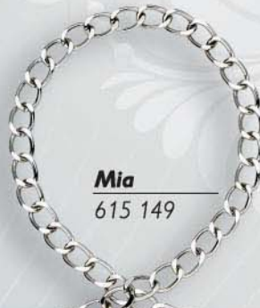
Mia 615 149