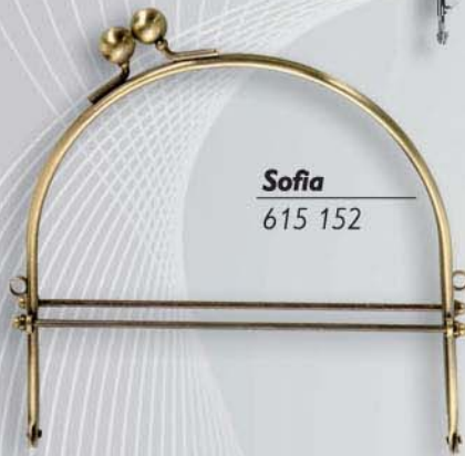
Sofia 615 152