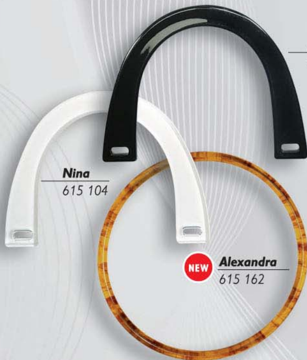
Nina 615 104