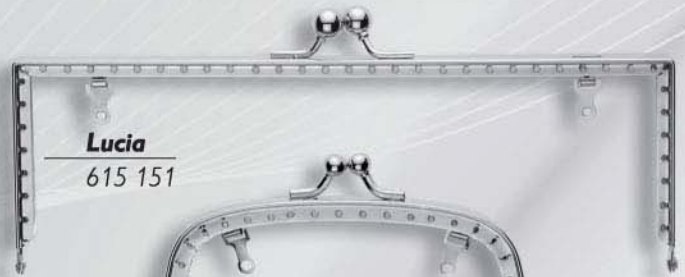
Lucia 615 151