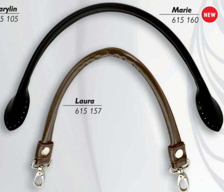
Marie NEW 615 160